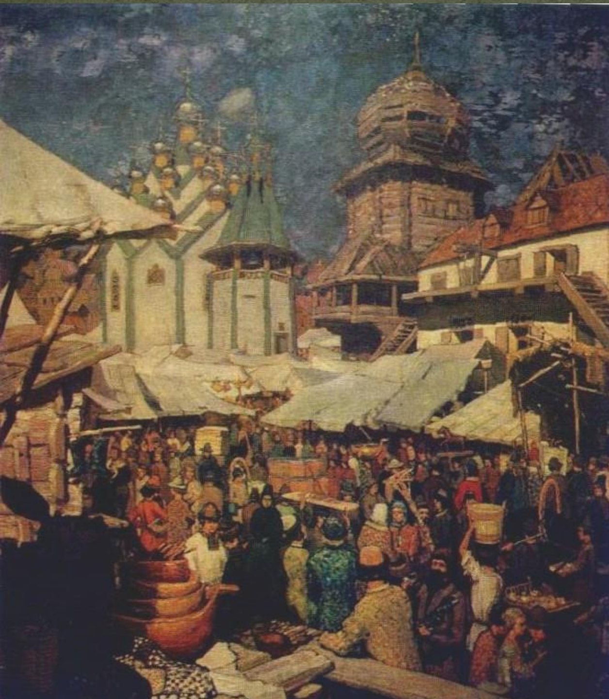
Торговая площадь, торг