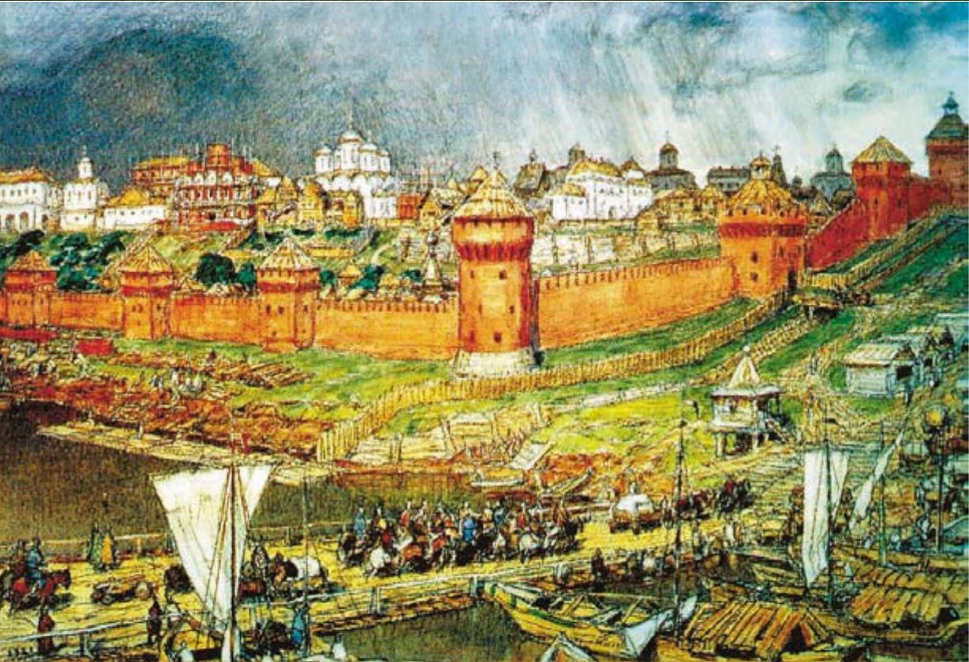
Кирпичные стены. Кирпич делали из глины и песка